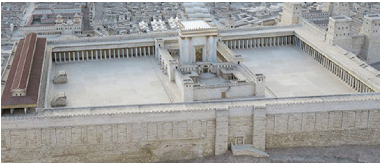
Segundo Templo, donde se ven todas las columnatas del pórtico de Salomón

Se le llamaba pórtico o columnata de Salomón a los dos pórticos asociados con el templo en Jerusalén. El templo original, construido por el Rey Salomón, se describe en 1 Reyes: «La casa que el rey Salomón edificó a Jehová tenía sesenta codos de largo [90 pies] y veinte de ancho [30 pies], y treinta codos de alto [45 pies]. Y el pórtico delante del templo de la casa tenía veinte codos de largo [30 pies] a lo ancho de la casa, y el ancho delante de la casa era de diez codos [15 pies]» (1 Reyes 6:2-3).